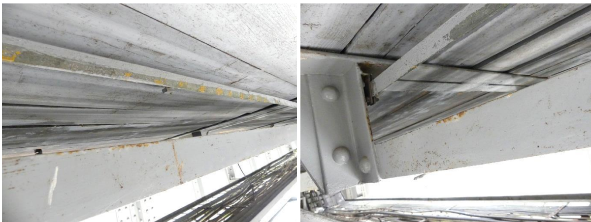
Obrázek 4 Korozní napadení kabelové lávky