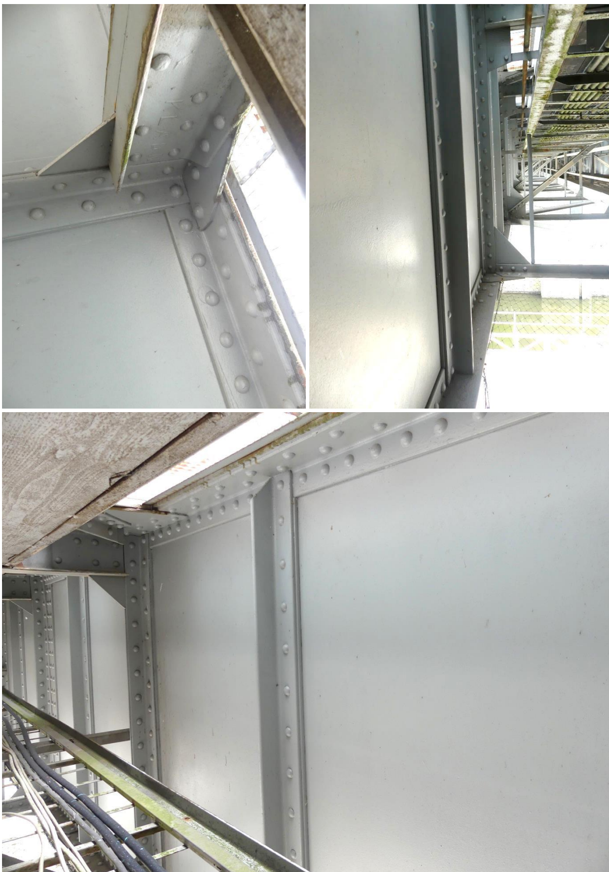
Obrázek 1a Ocelová konstrukce 1. patra – stav nátěrového systému