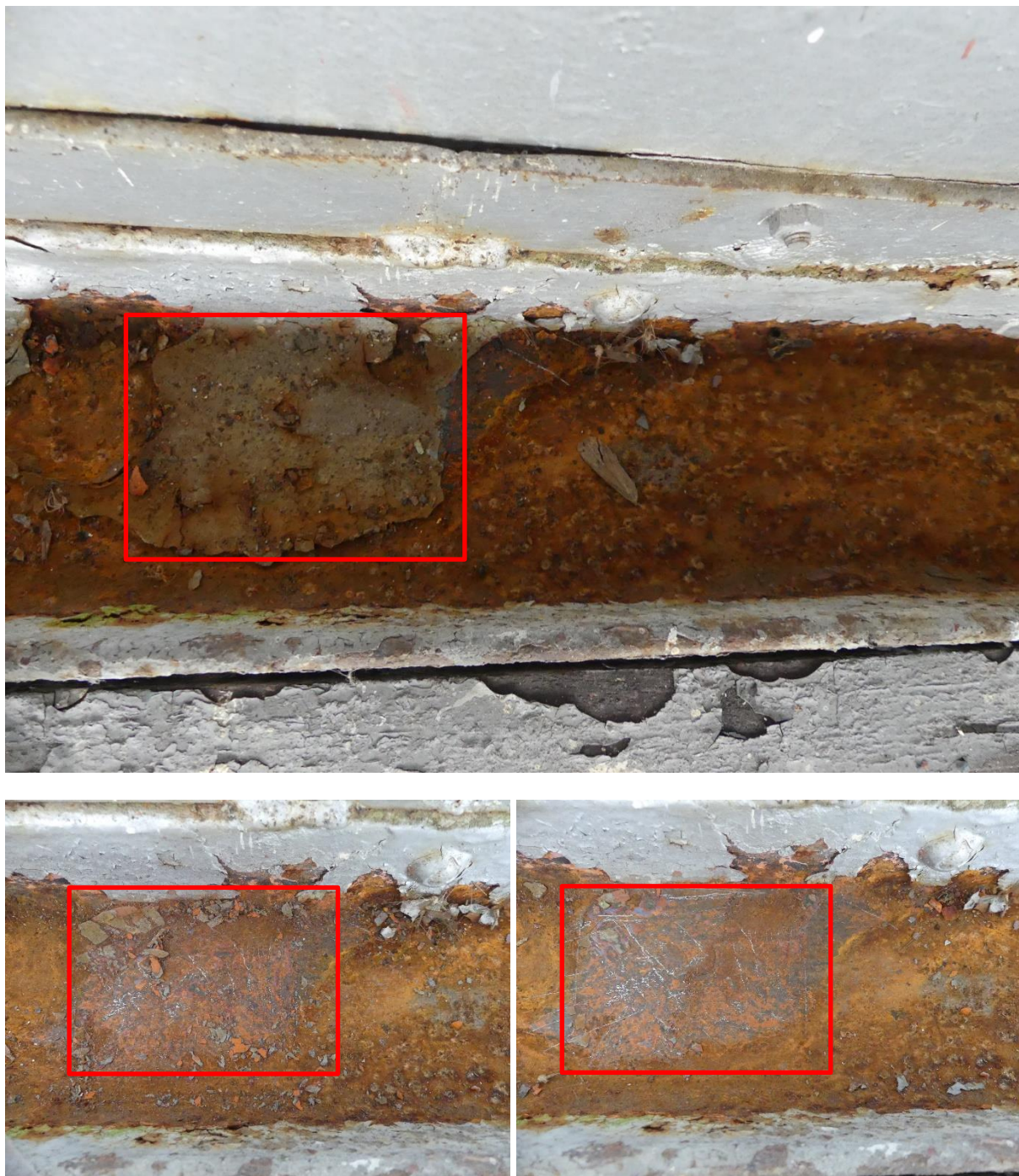
Obrázek 10 Místo odběru vzorku pro stanovení PCB