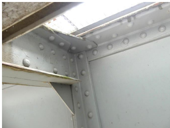
Obrázek 1b Ocelová konstrukce 1. patra – stav nátěrového systému