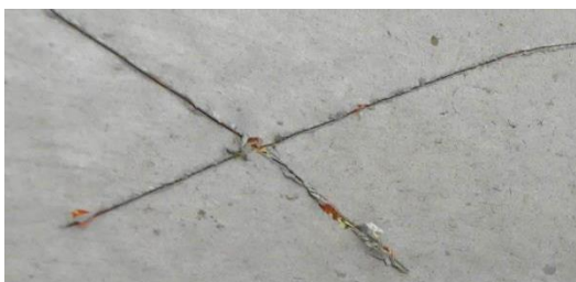
Obrázek 9 Horní nosník - přilnavost