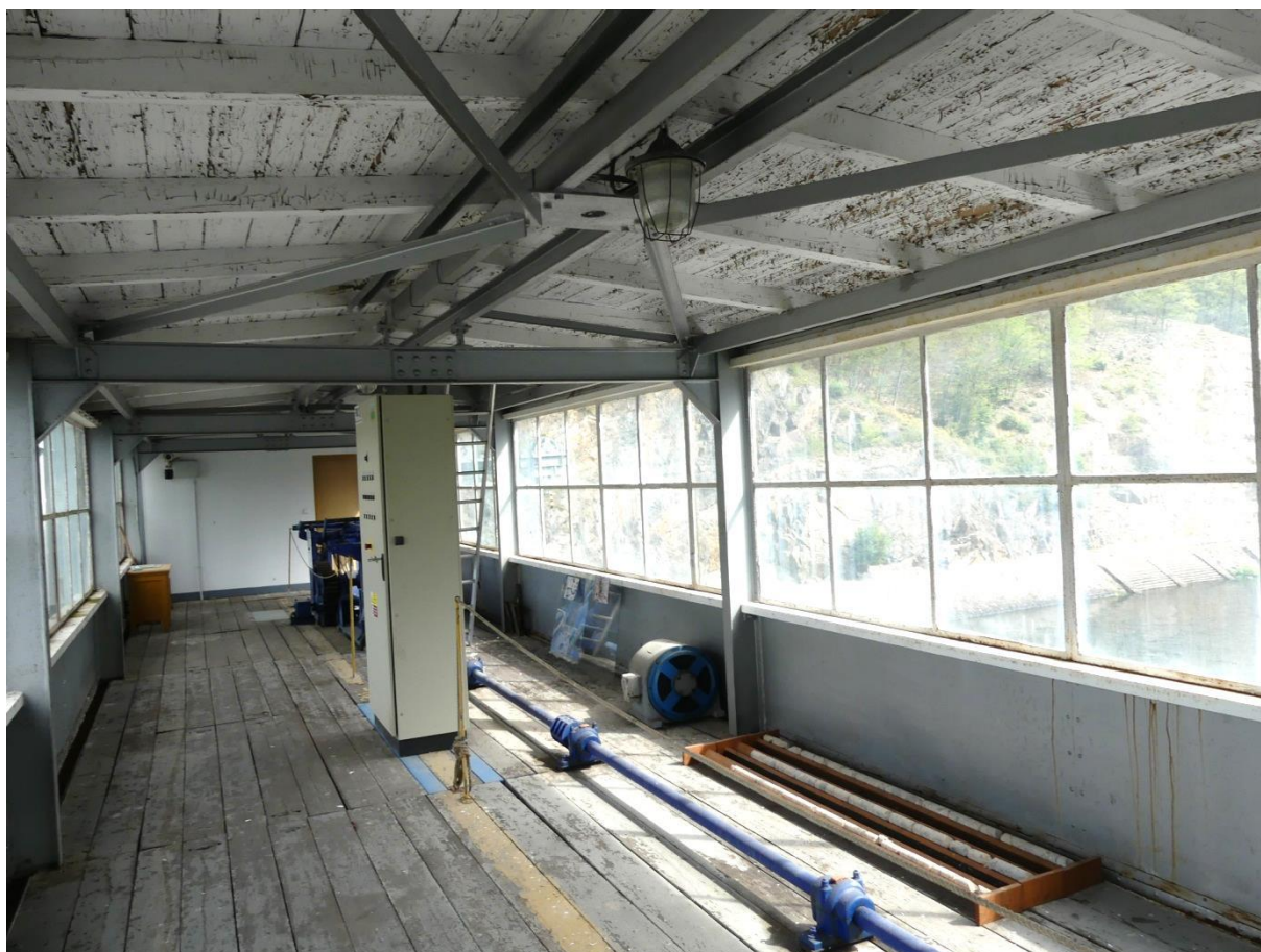
Obrázek 5 Horní patro