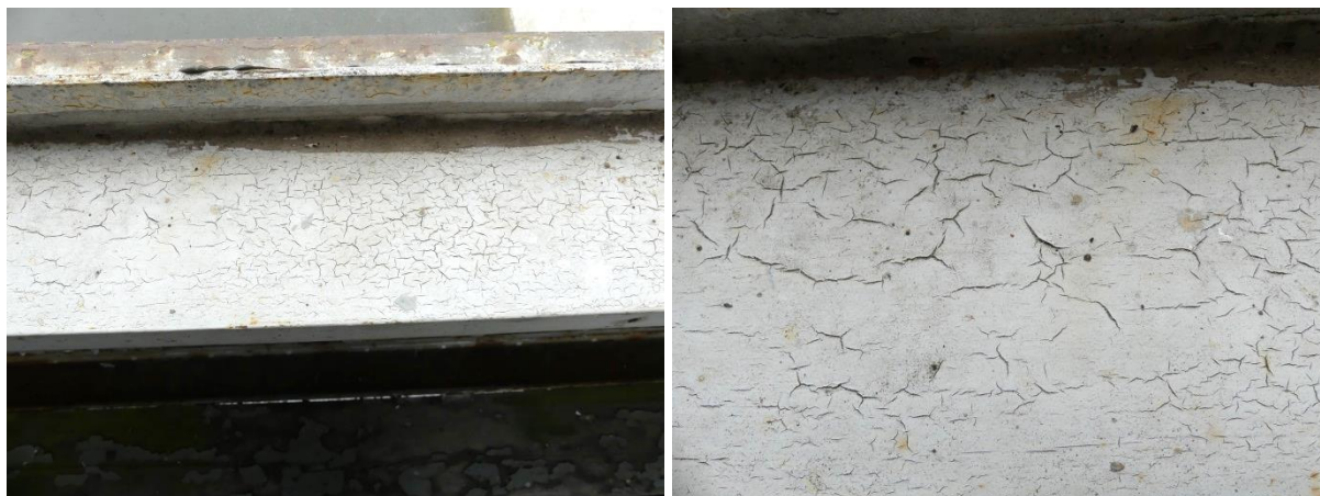
Obrázek 6 Degradace nátěrového systému pod okny