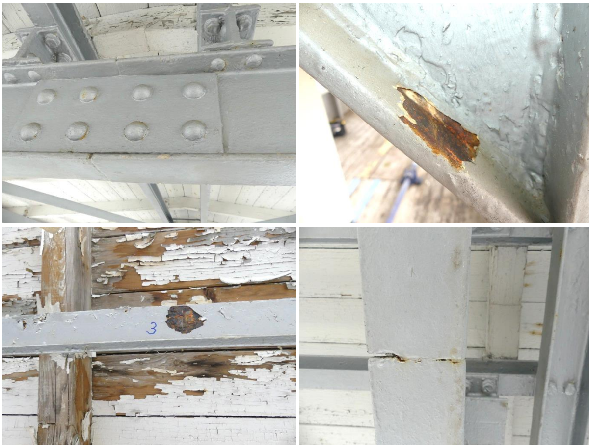
Obrázek 8 Horní nosníky, odlup, praskání, oprava nátěrového systému po odlupu původních vrstev