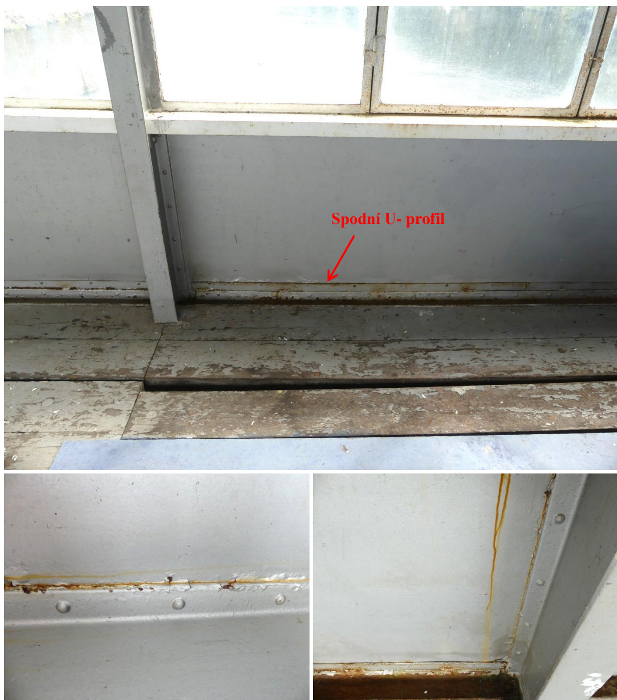
Obrázek 7 Stav PKO u obložení stěn