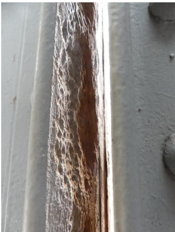
Obrázek 2 Místo bez nátěru, s